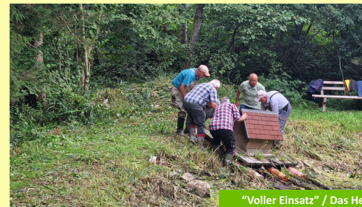
"Voller Einsatz" / Das Helferteam 2025