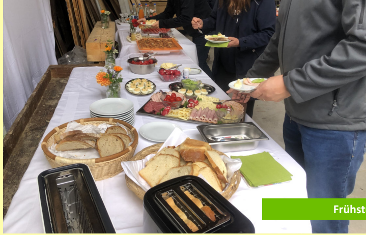
Frühstück bei Hermine