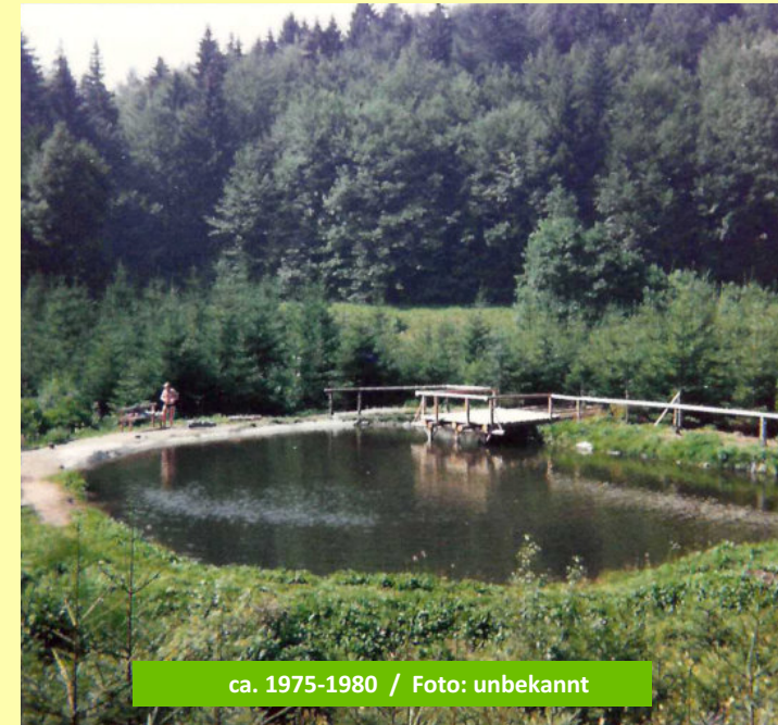
ca. 1975-1980