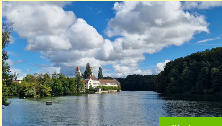
Wanderung um die Klosterinsel Rheinau "mit dem Schiff ganz nah am Wasserfall"